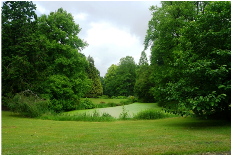
Sint-Niklaas Belsele Groenhof zicht over landschappelijk aangelegde tuin