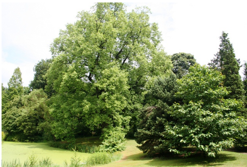
Sint-Niklaas Belsele Groenhof Amerikaanse tulpenboom