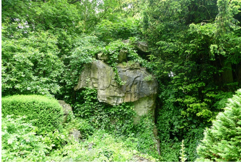
Sint-Niklaas Belsele Groenhof rotsen in cementrustiek