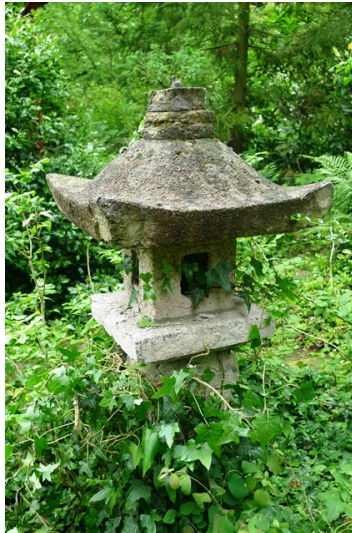
Sint-Niklaas Belsele Groenhof Japanse tuin lantaren