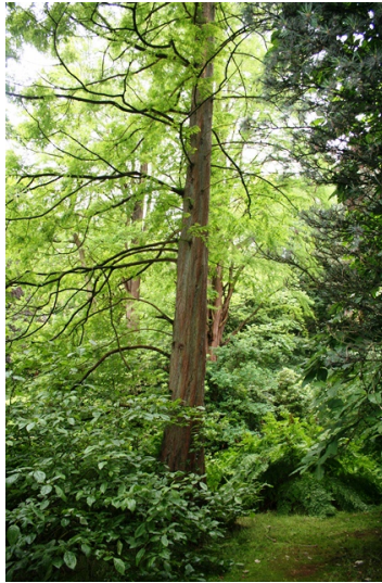
Sint-Niklaas Belsele Groenhof moerascypres