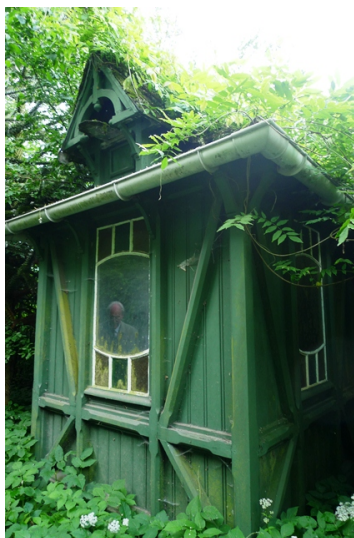
Sint-Niklaas Belsele Groenhof voormalige portiersloge SVK