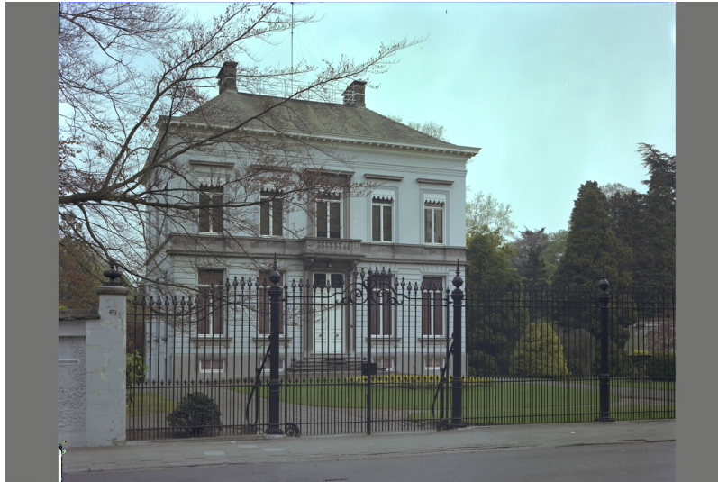
Sint-Niklaas Belseledorp 133 (Vlaamse Gemeenschap, 01-01-1970,)