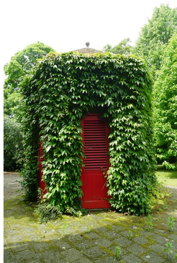
Sint-Niklaas Belsele Groenhof achthoekig paviljoentje toiletten