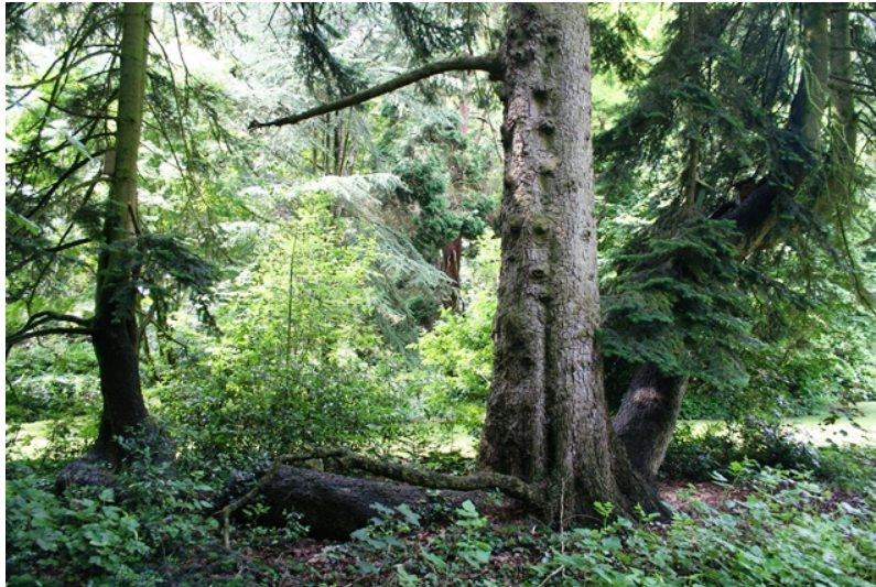
Sint-Niklaas Belsele Groenhof meerstammige Kaukasische zilverspar