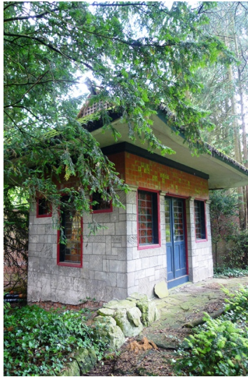
Sint-Niklaas Belsele Groenhof theehuis op een kunstmatige heuvel