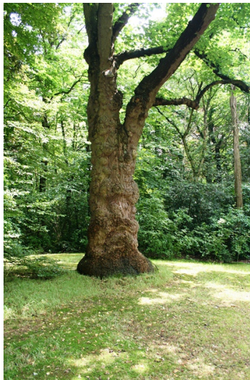
Sint-Niklaas Belsele Groenhof Amerikaanse tulpenboom achteraan tuin