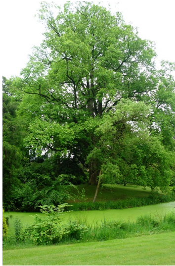
Sint-Niklaas Belsele Groenhof Amerikaanse tulpenboom kampioenboom