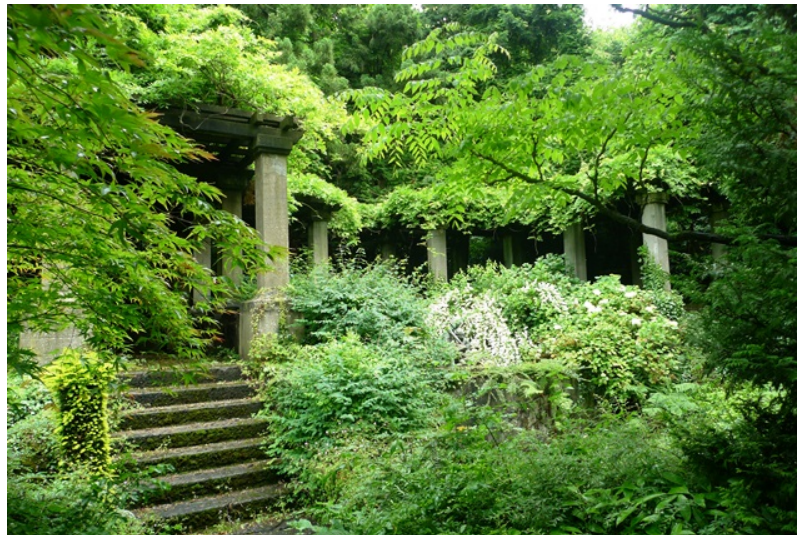
Sint-Niklaas Belsele Groenhof pergola