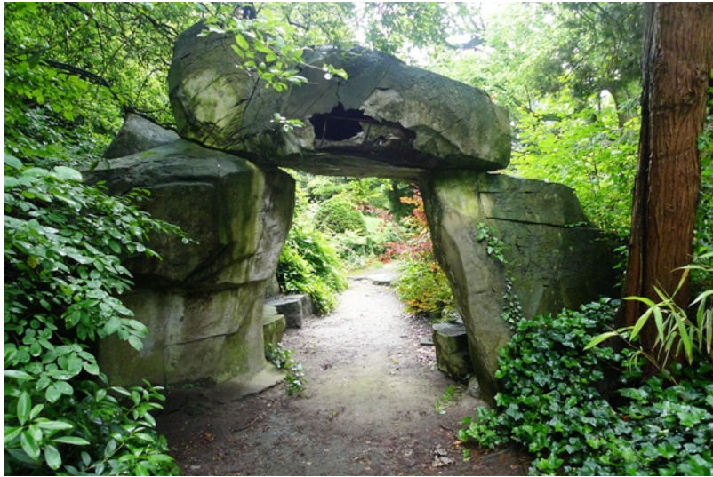
Sint-Niklaas Belsele Groenhof onderdoorgang in cementrustiek