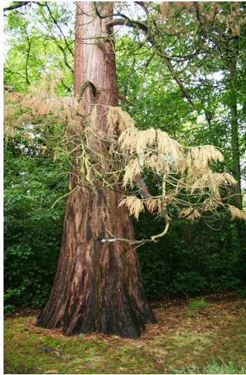
Sint-Niklaas Belsele Groenhof stam mammoetboom