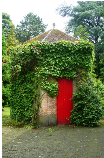
Sint-Niklaas Belsele Groenhof achthoekig paviljoentje kolenhok met berging