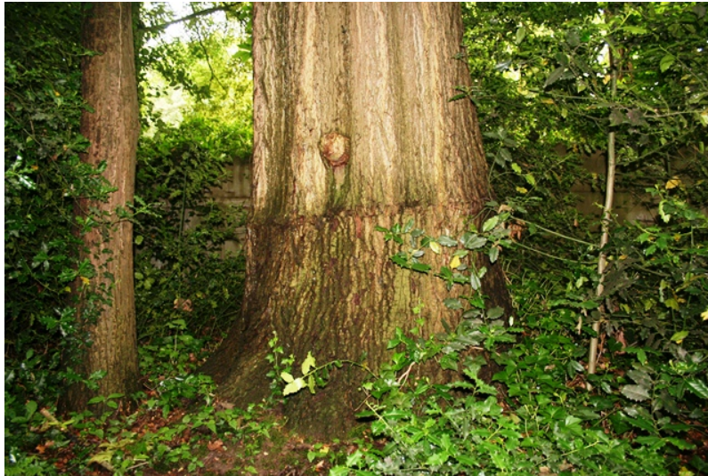
Sint-Niklaas Belsele Groenhof geente Amerikaanse eik op onderstam zomereik