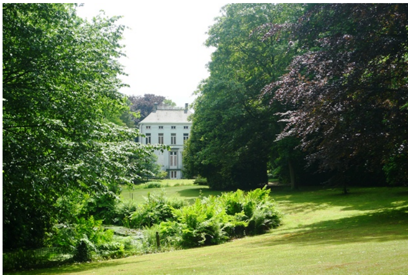
Sint-Niklaas Belsele Groenhof zicht over de serpentinevijver naar het herenhuis