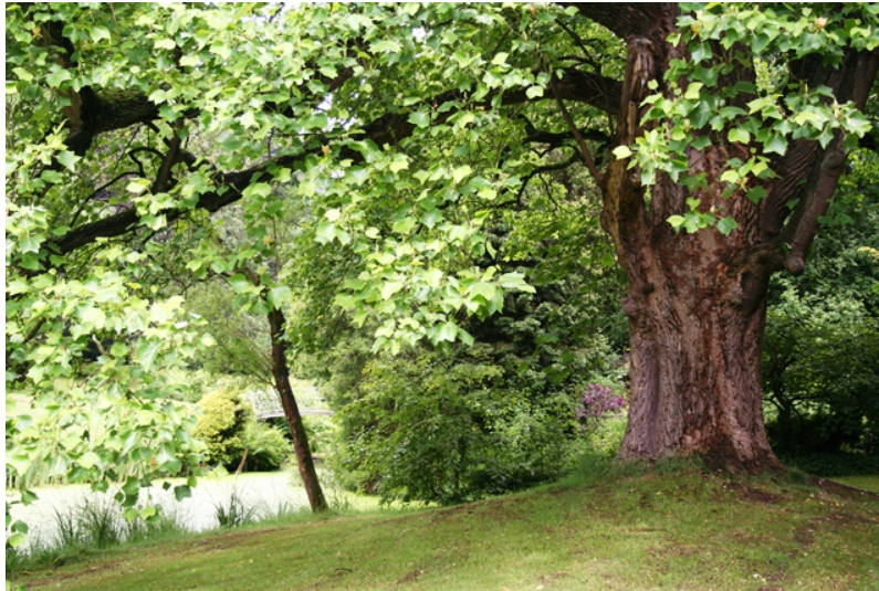
Sint-Niklaas Belsele Groenhof Amerikaanse tulpenboom stam