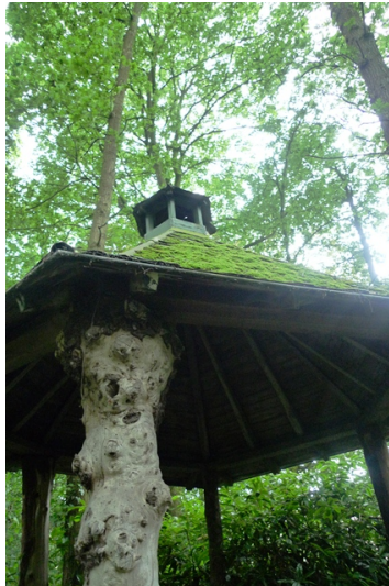
Sint-Niklaas Belsele Groenhof belvedère op heuveltje