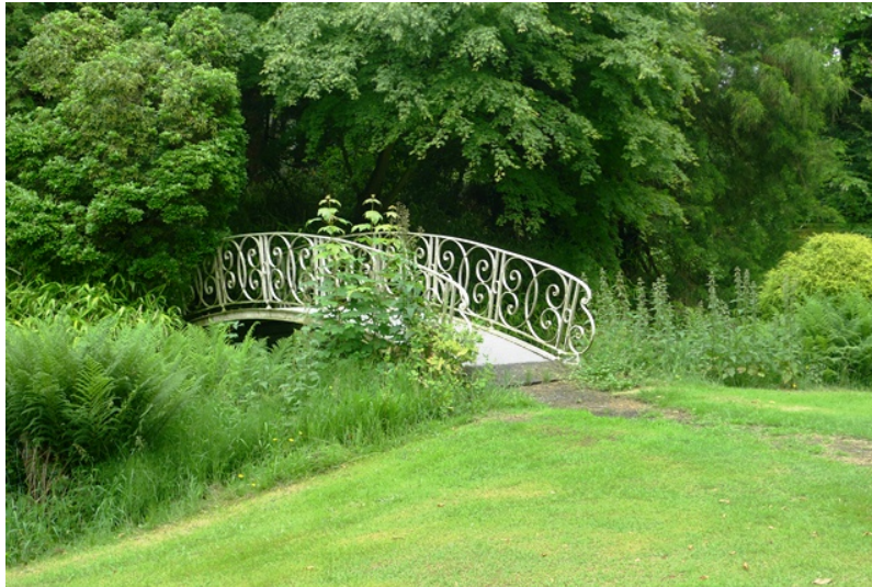
Sint-Niklaas Belsele Groenhof gietijzeren brug over serpentinevijver