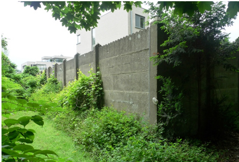
Sint-Niklaas Belsele Groenhof betonnen tuinmuur