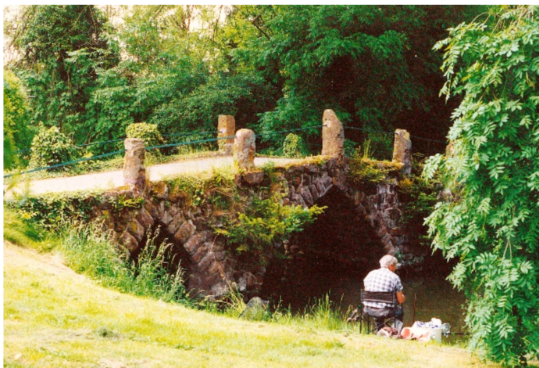
De "gotische" boogbrug bij het aalmoezeniershuis van de voormalige abdij Vrouwenpark