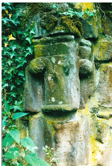
Recyclage van afbraakmateriaal van de abdij van Vrouwenpark in de "gotische" boogbrug bij het aalmoezeniershuis