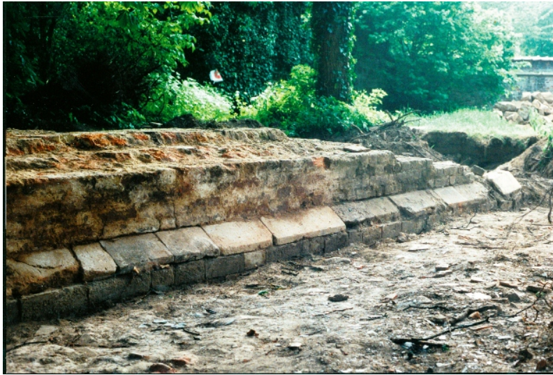
De in 1997 vrijgelegde noordwand van de 13de-eeuwse abdijkerk van Vrouwenpark