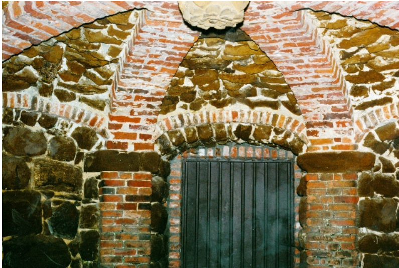
Het koepelgewelf met hergebruikte gewelfsleutel in het tuinpaviljoen in het voormalige abdiydomein Vrouwenpark