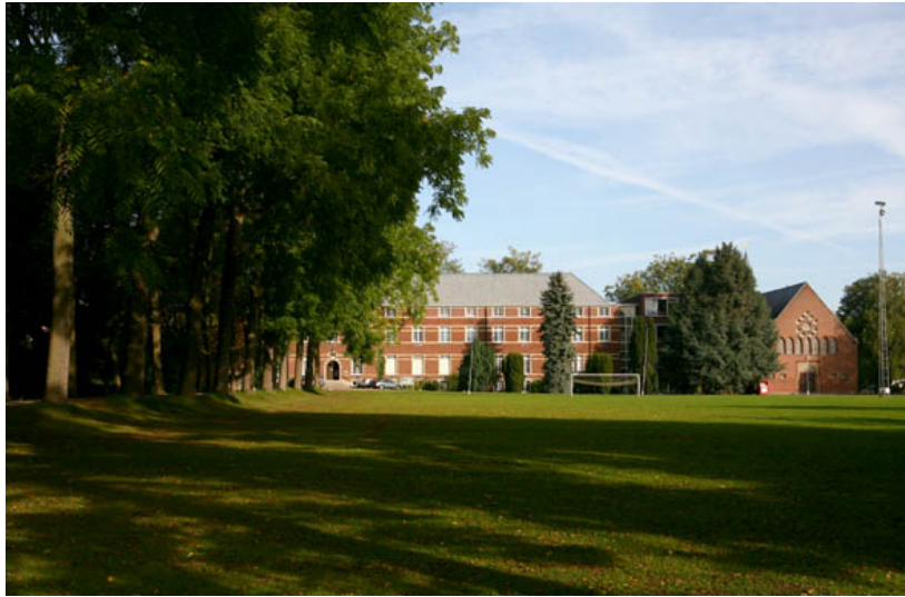
Rotselaar Aarschotsesteenweg 39